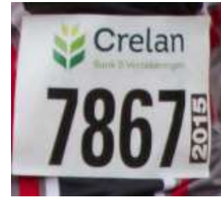
AZW clubtruitje en topje