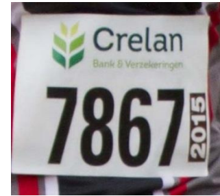
AZW clubtruitje en topje